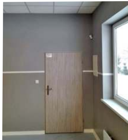
Jedno z wyremontowanych pomieszczeń Świetlicy Wiejskiej w Piekarach

Sołectwo Piekary otrzymało również grant „Infrastruktura sołecka na plus” w wysokości 100 tys. zł. na remont świetlicy w Piekarach. W ramach realizacji zadania wykonano izolacje cieplne i przeciwdźwiękowe z wełny mineralnej, sufity podwieszane, tynkowanie, gipsowanie i malowanie ścian. Założono też posadzki i wewnętrzne parapety. Realizacja projektu objęła też ułożenie instalacji elektrycznej i montaż oświetlenia. Całkowity koszt zadania zamknął się kwotą 115 tys. zł. Kwotą 15 tys. zł dołożyła Gmina.